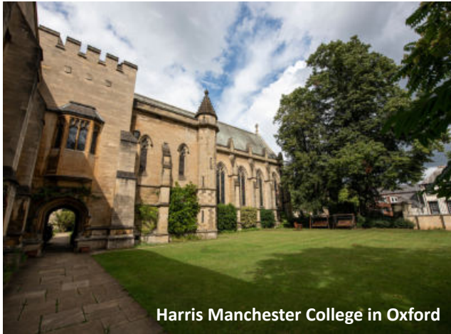
Harris Manchester College in Oxford