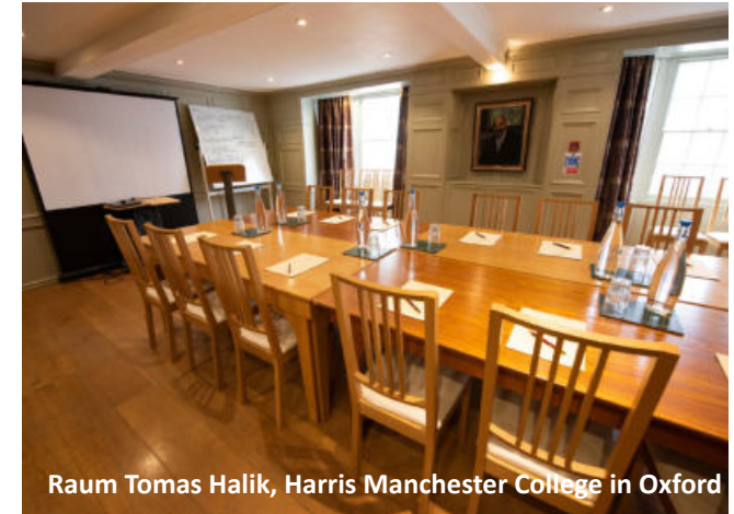
Raum Tomas Halik, Harris Manchester College in Oxford