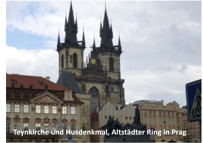
Teynkirche und Husdenkmal, Altstädter Ring in Prag

Wir wollen hinschauen und hinspüren, was sich dort tut und an einem dritten Seminarwochenende in Tübingen die Ergebnisse unserer Erkundungen an die aktuelle Praxis in Deutschland – Baden-Württemberg – der Diözese Rottenburg-Stuttgart herantragen, um Wegweiser für die bevorstehende Reise aufzustellen. Für die Katholisch-theologische Fakultät Tübingen ist „Zeitgenossenschaft“ eine ständige Zielsetzung.